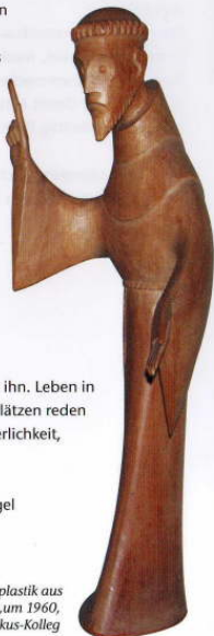
HL.Franziskus, Holzplastik aus der Schule von Matarée, um 1960, Franziskus-Kolleg

1210 Papst Innozenz III. bestätigt die Regel der „Minderen Brüder“.