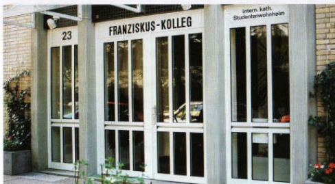
Eingang zum Franziskus-Kolleg