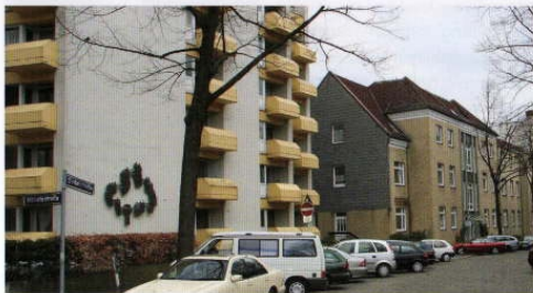
Franziskus-Kolleg, Haus 23 und 24

Die Gemeinschaftsräume bieten Möglichkeiten zur Kommunikation und zur Kontaktpflege.