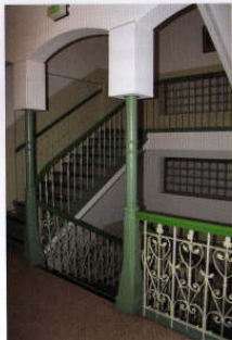
Treppenhaus im Franziskus-Kolleg

Bei mehrtägigen Freizeiten, insbes. für die Familien, erholen sich die Teilnehmer/-innen bei Spiel, Sport und Gängen durch die Natur. In gemütlicher Runde pflegen