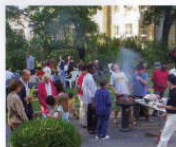
Impressionen vom Sommerfest 2008