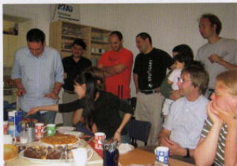
Gemütliches Treffen in der KHG im Juli 2007

In diesem Jahr feiert das Franziskus-Kolleg seinen 50. Geburtstag. Von diesen 50 Jahren leben Franziskus-Kolleg und Hochschulgemeinde sieben Jahre gemeinsam unter einem Dach. Und man darf zu Recht sagen, dass vieles bereits zusammengewachsen ist, was auch zusammengehört. Es sind nicht nur die vielen gemeinsamen Veranstaltungen, die von den Studenten des Franziskus-Kollegs und der Hochschulgemeinde besucht werden. Es sind auch die unzähligen Schnittmengen beider Einrichtungen, die ein Zusammenwachsen fördern. So sind Mitglieder der Hochschulgemeinde auch Bewohner des Franziskus-Kollegs; in der Seelsorge wird nicht zwischen der Seelsorge der Bewohner und der Seelsorge der Hochschulgemeindeglieder unterschieden.