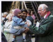
Tagesausflug zu Hagenbecks Tierpark

Bei den Tagesausflügen während des Semesters lernen gerade die ausländischen Studenten/-innen Norddeutschland intensiver kennen und vielleicht auch schätzen.